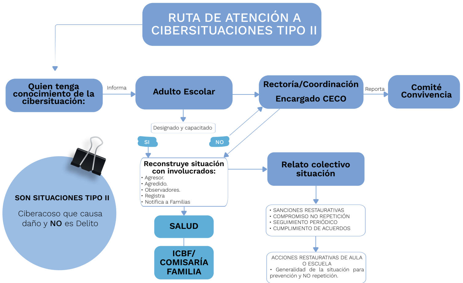
Figura 2. Ruta de atención a cbersituaciones Tipo II.